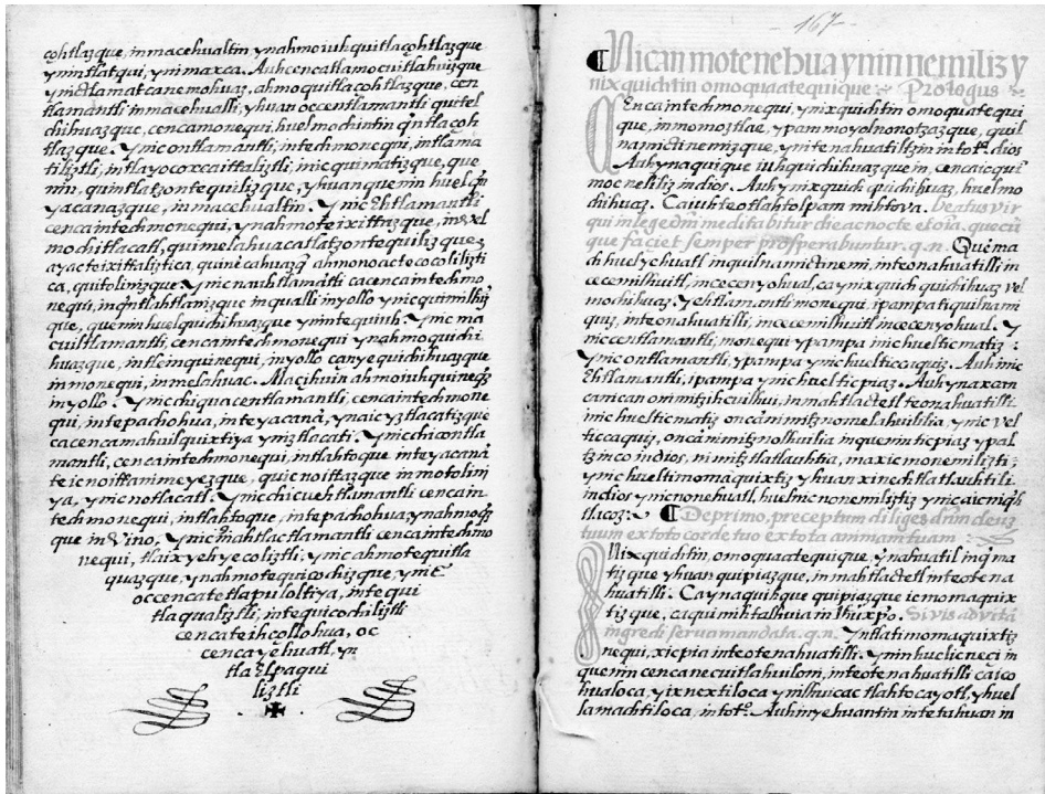
Figura 1. Inicio del Nican motenehua yn innemiliz yn ixquichtin omoquaatequique , manuscrito 1477, “Miscelánea sagrada”, Biblioteca Nacional de México, f. 166v-167r.

cristianismo. Textos como estos ofrecen la oportunidad excepcional de observar las elecciones hechas por los escritores nahuas en circunstancias de menos supervisión, al contrario de aquellos que escribieron en el contexto del scriptorium mendicante. Al observar qué textos cristianos eligieron para copiar, traducir o adaptar, así como las decisiones en sus adaptaciones, comprendemos mejor que el tronco cristiano produjo muchas ramas cuando se plantó en suelo mesoamericano. Textos como la adaptación de la “Leyenda de la madera sagrada” constituyen la oportunidad de vislumbrar, como lo hizo Set, los muchos tlamahuizolli de la escritura náhuatl en las periferias intelectuales del dominio colonial.